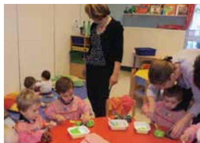
ateliers partagés à la crèche