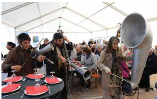
buffet en musique avec la Fausse Compagnie

Tandis que les plus matinaux ont été accueillis avec un café, ceux ayant choisi une visite en fin de matinée ont pu déjeuner sur le site. Près de 300 personnes se sont réunies autour d'un buffet froid accompagné par un orchestre, le tout dans une ambiance très conviviale et champêtre !