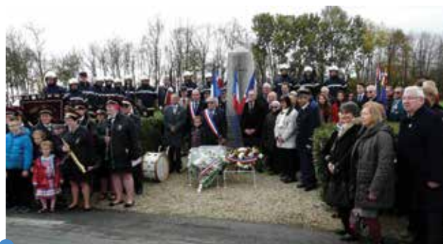
la stèle des Saint-Cyriens avec le général d'Anselme