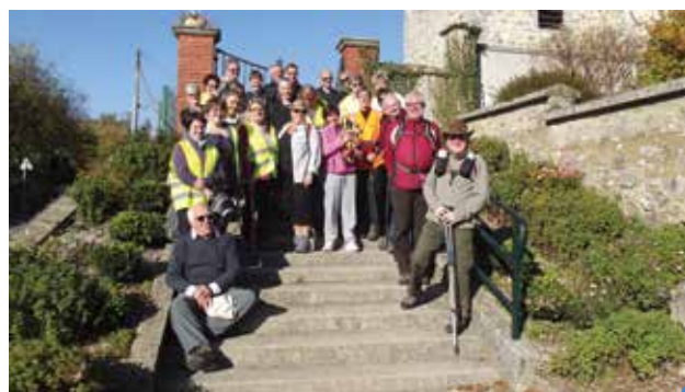
randonnée à Lachy

Vous pouvez consulter la totalité de nos dates sur notre site, dans l'agenda de ce bulletin ou encore sur nos programmes distribués ici et là dans les boutiques de Montmirail.