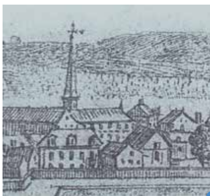
l'église de l'abbaye