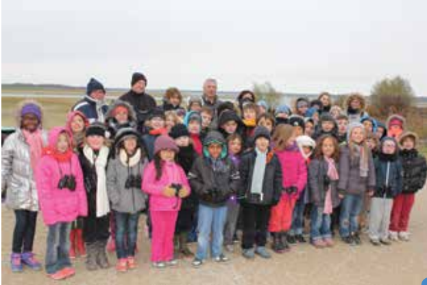
prêts à observer les oiseaux avec les jumelles

Fin novembre, les élèves du CP au CM2 de l'école élémentaire du regroupement Le Gault, Morsains, Tréfolis et six adultes sont allés au lac du Der pour deux journées.