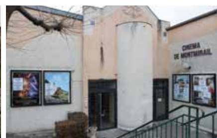
le totem (à gauche) et les nouvelles portes