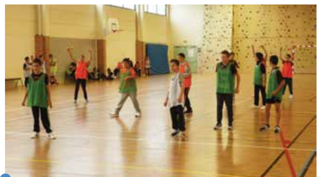
Journée du Sport en septembre