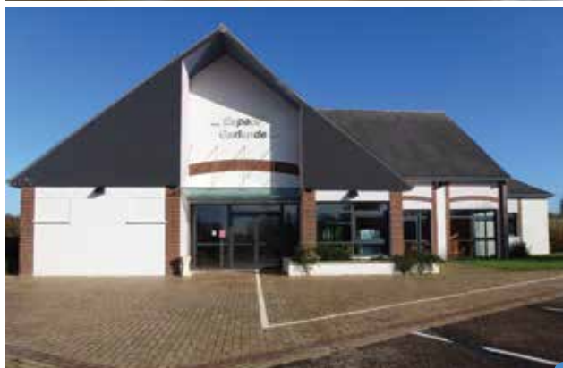
seconde jeunesse pour la salle des fêtes de Le Gault-Soigny