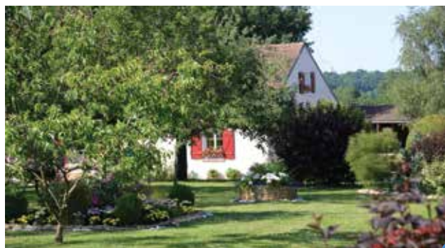
maison fleurie de M. et Mme Jeanne

La remise des prix des Maisons Fleuries 2015 a eu lieu jeudi 26 novembre à la salle Roger Perrin. Félicitations à tous les participants et aux lauréats ci-dessous.