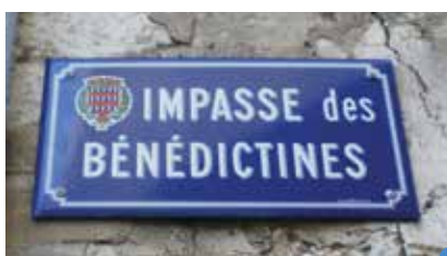
la plaque posée il y a une dizaine d'années

La porte cochère était large et profonde. Les murs des deux côtés étaient en pierre de taille et portaient une voûte en plein cintre. La porte sur la rue restait ouverte tout le jour, mais la porte sur la cour du monastère roulait rarement sur ses gonds.