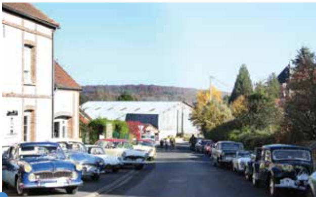
un beau plateau pour ce premier rallye