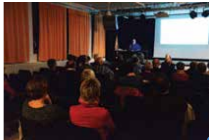
conférence «Vivons-nous la fin de notre système de santé ?»