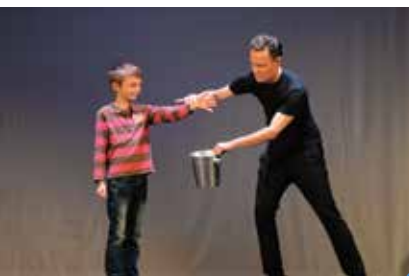
spectacle «Magie d'ombres et autres tours»