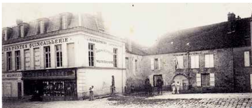
le magasin Bourbonneux, la fontaine du bourg et l'ancienne gendarmerie, à l'emplacement de l'abbaye

Sources: bulletin de la paroisse de Montmirail de 1929; extraits du plan Bouchon de 1745; CPA: éditions Ries Documents Mairie de Montmirail, Monique Duteil.