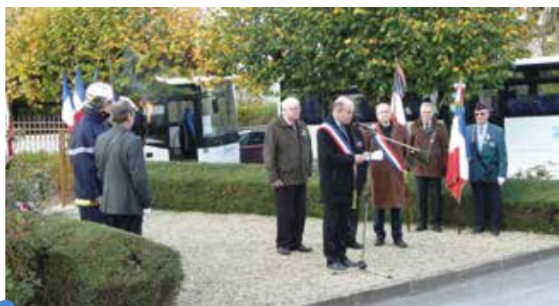
commémoration en présence de notre député M. Philippe Martin

Les traditionnelles commémorations du 11 novembre ont été rehaussées par la présence de Monsieur Philippe MARTIN, député de la Marne et des représentants des promotions Saint-Cyriennes Camerone , Tom Morel , Marne et Verdun et d'une délégation d'officiers de l'École d'Officiers de la Gendarmerie Nationale.