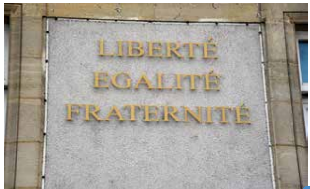
la devise est désormais sur le fronton de la mairie

Qu'est-ce que je fais pour la LIBERTÉ, l'ÉGALITÉ, la FRATERNITÉ?