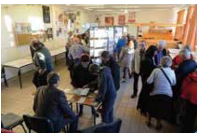
6 exposition «Un siècle de commerce et d'artisanat»