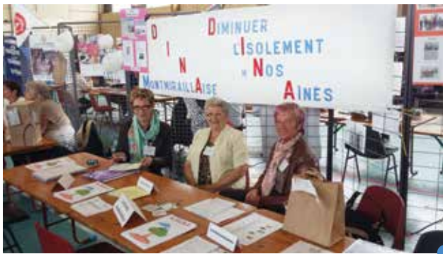
la D.I.N.A. au Forum des Associations 2015

Les retombées ont été positives et intéressantes.