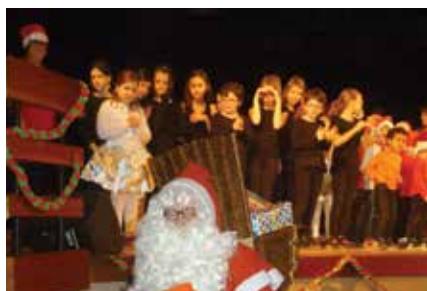
chants, danse, cirque et cadeaux pour le centre de loisirs