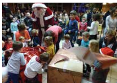
Noël pour Les P'tites Hirondelles

pré- inscriptions pour la rentrée de septembre 2016