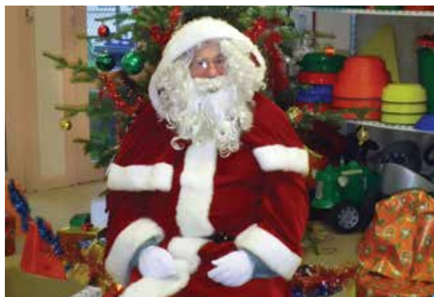
le père Noël est venu rendre visite à l'école maternelle

La mairie de Montmirail nous a invités à un spectacle de fin d'année: GÉGÉ LE CLOWN. Nous nous sommes bien amusés. Vendredi 18 décembre nous avons eu la joie d'accueillir le père Noël qui nous a offert à chacun un livre et un père Noël en chocolat. Il a aussi offert des cadeaux pour toutes les classes. L'année 2016 commencera par une séance de cinéma dans le cadre du projet «école et cinéma».