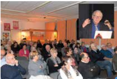
conférence «Les femmes résistantes pendant la guerre»