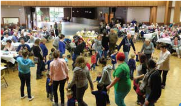
spectacles, danses et convivialité pour la Semaine Bleue