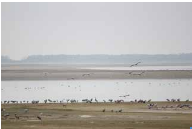
les grues au lac du Der

Puis le groupe est parti à Giffaumont pour regagner le centre où passer la nuit. En route, le car s'est arrêté pour admirer des grues posées dans un champ qui cherchaient pitance. Près du lac c'était magnifique, que de grues cendrées ! Les animateurs ont proposé des jumelles pour observer les oiseaux dans les moindres détails. Des hérons et des cormorans, des mouettes, des oies, différentes espèces de canards. Et surtout des grues qui arrivaient de tous côtés, c'était impressionnant et merveilleux à la fois.