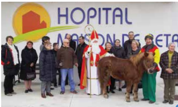
Saint-Nicolas en visite à l'Hôpital-Maison de retraite

Cela est devenu une habitude incontournable depuis plusieurs années à la D.I.N.A. Une fois encore, le brave Saint-Nicolas est venu rendre visite aux résidents de l'Hôpital-Maison de retraite, le jour-même de sa fête, le 6 décembre. Il était accompagné de sa ponette conduite par Éric le lutin vert. Ce fut un grand bonheur pour tous. Très palpable a été la joie des résidents de pouvoir caresser la douce ponette. L'après-midi s'est terminé par une distribution de friandises et un agréable rafraîchissement. Voyant autant d'étoiles scintiller dans les regards attendris, Saint-Nicolas a promis aux résidents de revenir les voir le 6 décembre 2016.