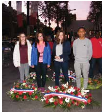
dépôt de gerbe par les collégiens

Tous les élèves sont rentrés enthousiasmés de cette journée qui restera, sans aucun doute, gravée dans leur mémoire.