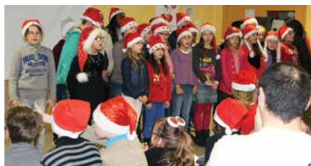
chants de Noël pour la fête de Noël