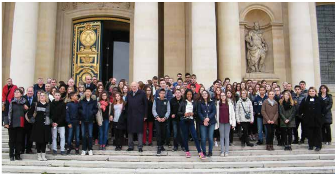
les 80 collégiens montmirailais et leurs accompagnateurs sur les marches de l'Hôtel des Invalides