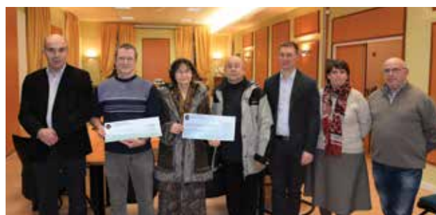
remise des chèques de subvention pour la rénovation des devantures du centre-ville

Consciente des difficultés économiques que rencontrent les commerçants actuellement, la commune de Montmirail maintient ce dispositif d'aide pour l'année 2016.