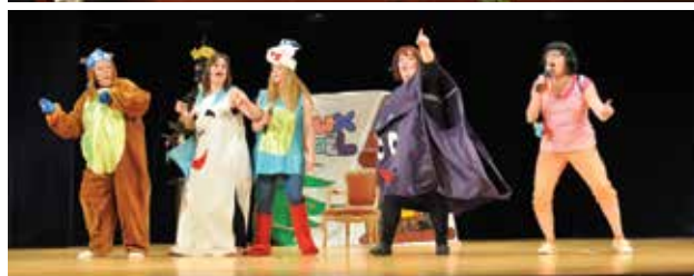
spectacle de fin d'année chez «Les P'tits Loups»