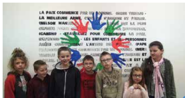
pendant le tournage du clip «On écrit sur les murs»